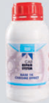
1K BASE CHROME EFFECT 5004-006051